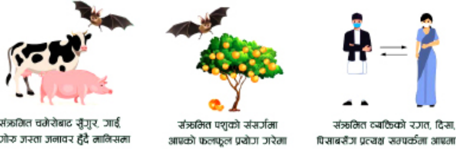
संक्रमित चमेरोबाट सुँगुर, जाई, जोरु जस्ता जनावर हुँदै मानिसमा

निपाह भाइरस जनावरबाट जनावर, जनावरबाट मानिस र मानिसबाट मानिसमा पनि सर्दछ ।