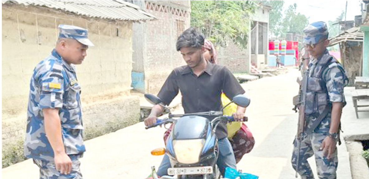
सम्बन्धित नेपाल-भारत सीमामा चेकजाँच गर्दै सशस्त्र प्रहरी ।